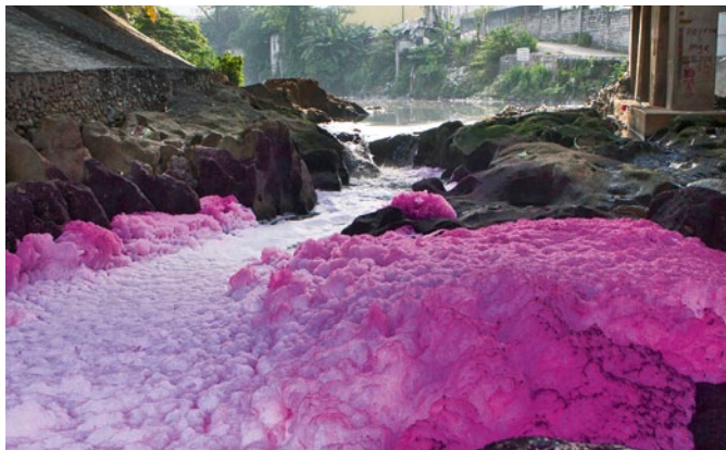
An den Farben der Flüsse in China erkennt man die Farben der Saison.

als 0,1 Prozent bestimmter Organozinnverbindungen enthalten, in der EU verboten.