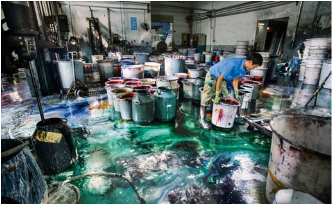
Färbefabrik Well Dyeing Ltd. am Pearl-Fluss in Zhongshan, China

die Chemikalien aus der Textilproduktion auch in den menschlichen Organismus. Doch die elf Chemikaliengruppen sind nur der Anfang – Greenpeace erwartet von der Textilindustrie, dass sie alle gefährlichen Chemikalien auf den Index setzt. Nur wenn alle Schadstoffe durch umweltfreundliche Alternativen ersetzt werden, können Umwelt und Gesundheit dauerhaft geschützt werden.